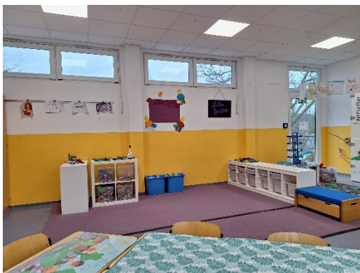
Lila Gruppe/ Bauraum: Iryna Statieva