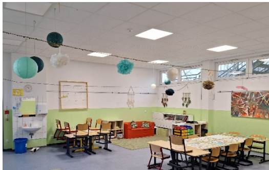
Grüne Gruppe/Ruhe Raum: Naziha Acchaoui